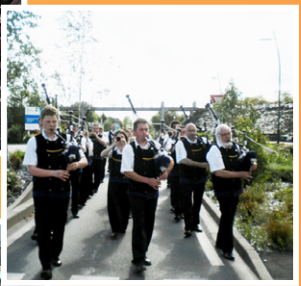
BAGAD MEN GLAZ