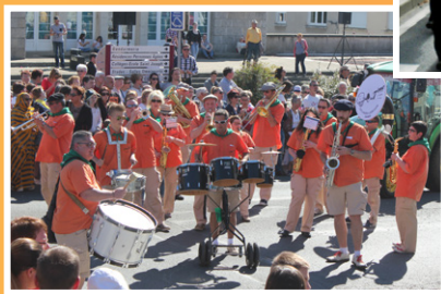
BANDA LA ZÈME