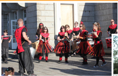
BATUCADA TIMBALADA (CMBB)